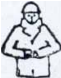
Tamam (işlemin sonu)

64. Kurşun ile yapılan çalışmalarda işyeri havasında bulunması gereken azami kurşun miktarı kaç mg/m 3 tür?