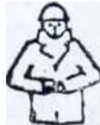
Tamam (işlemin sonu)

88. Kurşun ile yapılan çalışmalarda işyeri havasında bulunması gereken azami kurşun miktarı kaç mg/m 3 tür?